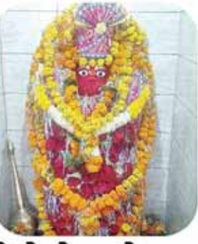
रेल्वे स्टेशन के पास