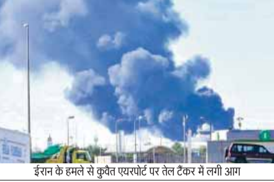
ईरान के हमले से कुवैत एयरपोर्ट पर तेल टैंकर में लगी आग