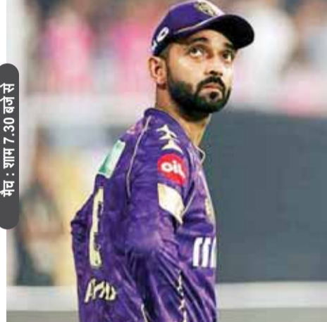
मैच : शाम 7.30 बजे

अपना अभियान पटरी पर लाने की कोशिश करेंगी सनराइजर्स हैदराबाद और केकेआर