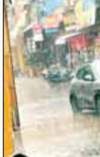
सीहोर में तेज हवा के साथ बारिश व ओले गिरे