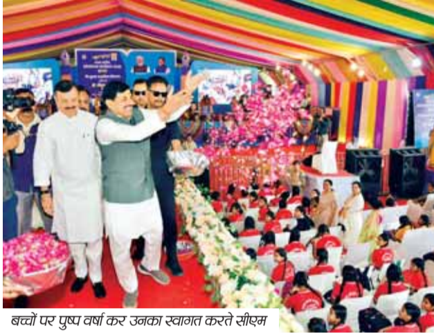
बच्चों पर पुष्प वर्षा कर उनका स्वागत करते सीएम

सरकारी स्कूलों के प्रति अभिभावकों बच्चों का आकर्षण बढ़ा : डॉ. यादव