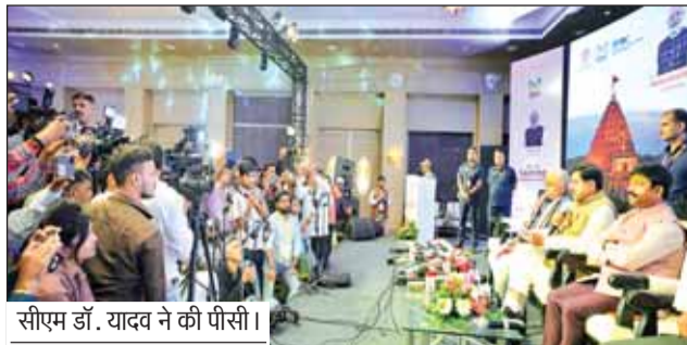
सोएम डॉ. यादव ने की पीसी।

■ मुख्यमंत्री ने एमपी-यूपी सहयोग सम्मेलन के बाद किया प्रेस कॉन्फ्रेंस को संबोधित