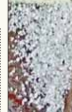
विदिशा में ओले

भोपाल में दो घंटे में 2 मिमी बारिश कई जगह पेड़ की शाखाएं गिरी