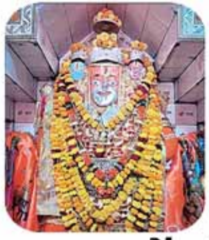
पुराना बस स्टैंड