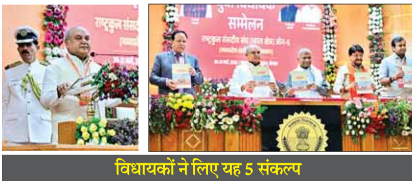
विधायकों ने लिए यह 5 संकल्प

विधानसभा अध्यक्ष नरेन्द्र सिंह तोमर ने कहा: यह केवल सरकार का नहीं बल्कि 140 करोड़ भारतीयों का संकल्प