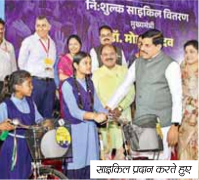
साइकिल प्रदान करते हुए