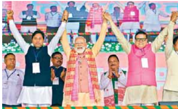
जनसभा से पहले प्रधानमंत्री मोदी

प्रधानमंत्री नरेंद्र मोदी ने बुधवार को असम के बिस्वनाथ जिला में एक जनसभा को संबोधित करते हुए कांग्रेस पर जमकर हमला बोला। उन्होंने कहा कि कांग्रेस ने वर्षों तक सत्ता के लिए असम की आत्मा, शान, पहचान और सुरक्षा से खिलवाड़ किया। प्रधानमंत्री ने आगामी विधानसभा चुनावों में भाजपा की जीत का दावा करते हुए कहा कि राज्य में तीसरी बार 'डबल इंजन सरकार' बनेगी। उन्होंने कहा कि यह भरोसा पिछले वर्षों में हुए विकास कार्यों पर आधारित है। पीएम मोदी ने आरोप लगाया कि कांग्रेस ने अपने वोट बैंक के लिए अवैध घुसपैटियों को बढ़ावा दिया और जमीन पर अवैध कब्जों को नजरअंदाज किया।