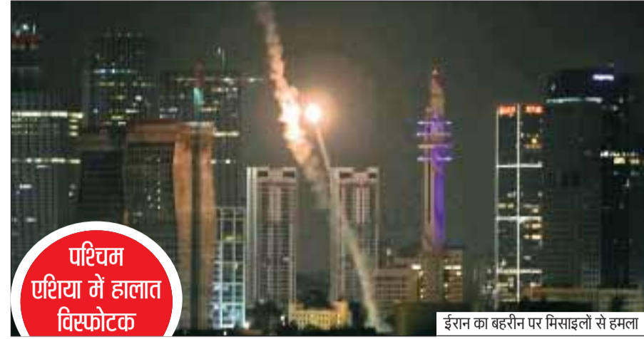
ईरान का बहरीन पर मिसाइलों से हमला